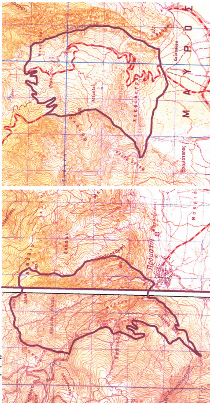
ΑΠΟΣΠΑΣΜΑ ΧΑΡΤΟΥ Γ.Υ.Σ. "ΠΡΟΜΑΧΟΙ" & "ΒΙΤΟΛΑΣΤΕ"