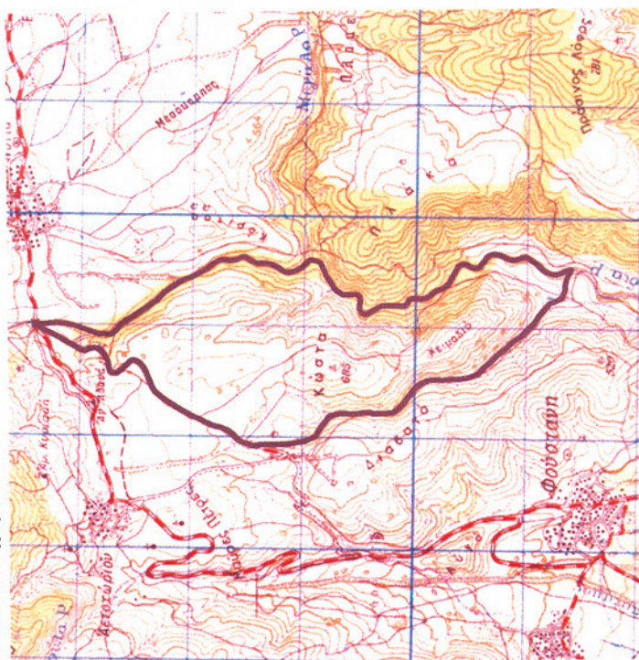
ΑΠΟΣΠΑΣΜΑ ΧΑΡΤΟΥ Γ.Υ.Σ. "ΠΡΟΜΑΧΟΙ"

ΔΑΣΑΡΧΕΙΟ ΑΡΙΔΑΙΑΣ ΚΑΘΟΡΙΣΜΕΝΟΣ ΧΩΡΟΣ ΕΚΓΥΜΝΑΣΗΣ ΚΥΝΗΓΗΤΙΚΩΝ ΣΚΥΛΩΝ Αριθμ. Δ.Α.Δ.: 5/2013 Ζ.Ε.Σ. Αετοχωρίου